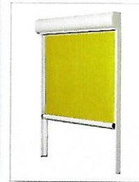
Lero I mit Schienenführung