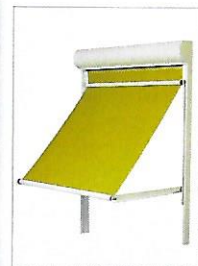
Lero III mit Markisolette, erhältlich mit Torsionsfeder 155°, Gasdruckfeder 145°