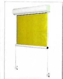
Lero II mit Seilführung