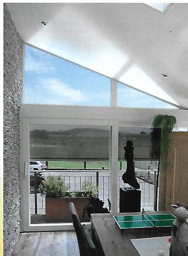
Beschattung mit zusätzlicher Sicht nach aussen dank Soltis-Stoffen