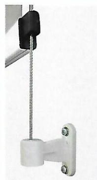
Lerotec II mit Seilführung